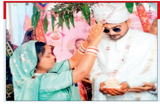
साहू परिवार ने एक ऐसी मिसाल पेश की है, जिसकी चर्चा जोरों पर है। यहाँ एक विधवा माता ने स्वयं अपने हाथों से बेटे के सिर पर 'मौर' सजाकर बारात विदा की।

आमतौर पर ग्रामीण और पारंपरिक समाजों में विधवा महिलाओं को मांगलिक कार्यों और मुख्य